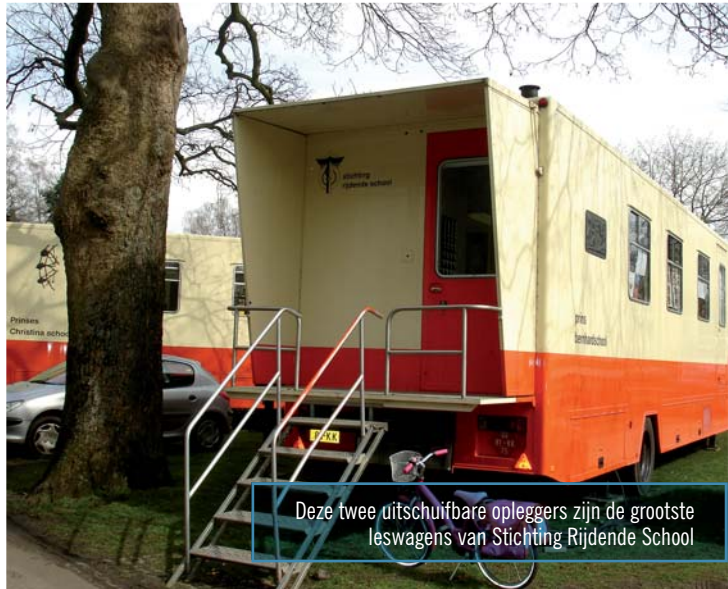
Deze twee uitschuifbare opleggers zijn de grootste leswagens van Stichting Rijdende School

De school heeft een eigen technische dienst, bestaande uit een hoofd en vier chauffeurs die tevens gekwalificeerd technisch vakman zijn. Zij bouwen het interieur van de school, zorgen dat de scholen op tijd worden geplaatst en zijn bovendien verantwoordelijk voor het onderhoud dat ze ter plaatse verrichten. Bij ingrijpend onderhoud gaat een school naar de werkplaats in Geldermalsen. De dagelijkse leiding is in handen van het managementteam, bestaande uit een algemeen directeur, een hoofd personeel & organisatie en een hoofd onderwijs.